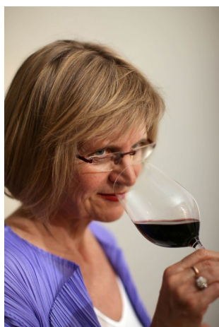
顧問 Jancis Robinson MW

東京青山本校、大阪校、名古屋特設クラスに加え、本格的なキッチンを完備した銀座教室も本年度オープン、韓国・ソウル校が2011年1月開校予定です。